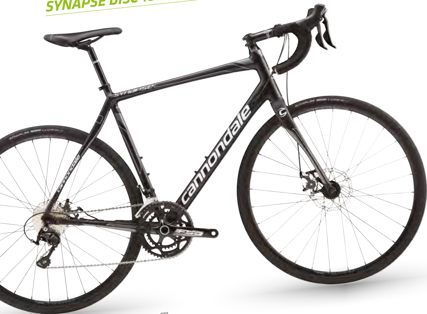
🔑 Jet Black w/ Charcoal Grey and Magnesium White, Matte - BBQ