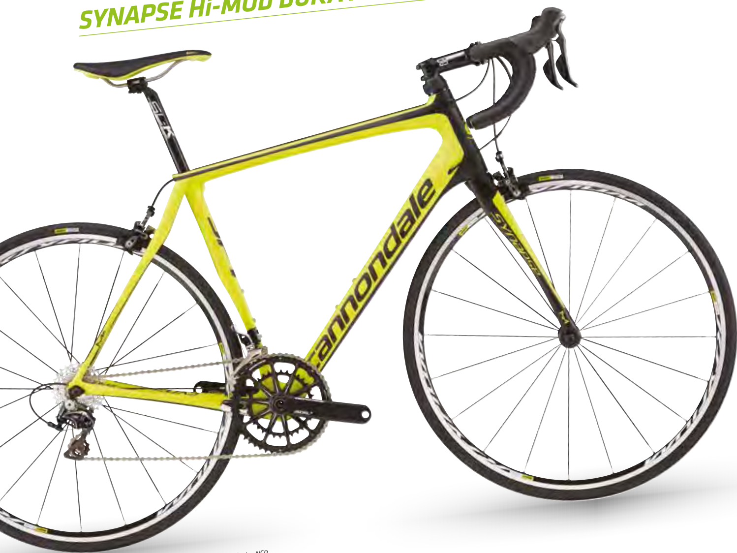
Neon Spring w/ Exposed Carbon and Nearly Black - NSP