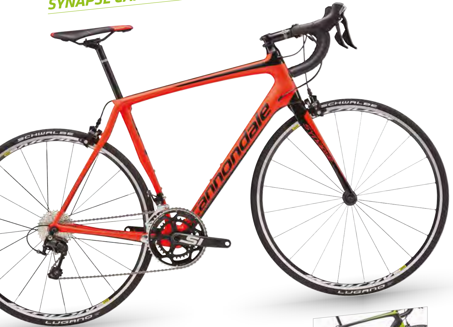
🔑 Acid Red w/ Jet Black, Matte - RED