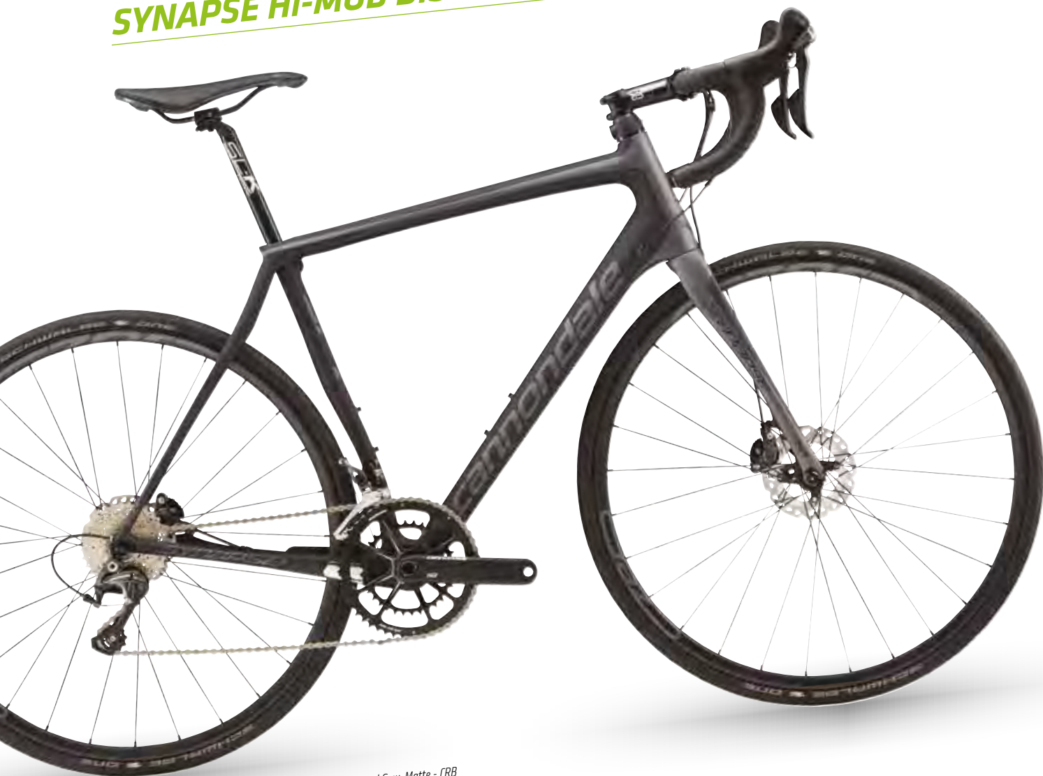
Exposed Unidirectional Carbon w/ Jet Black and Charcoal Grey, Matte - CRB