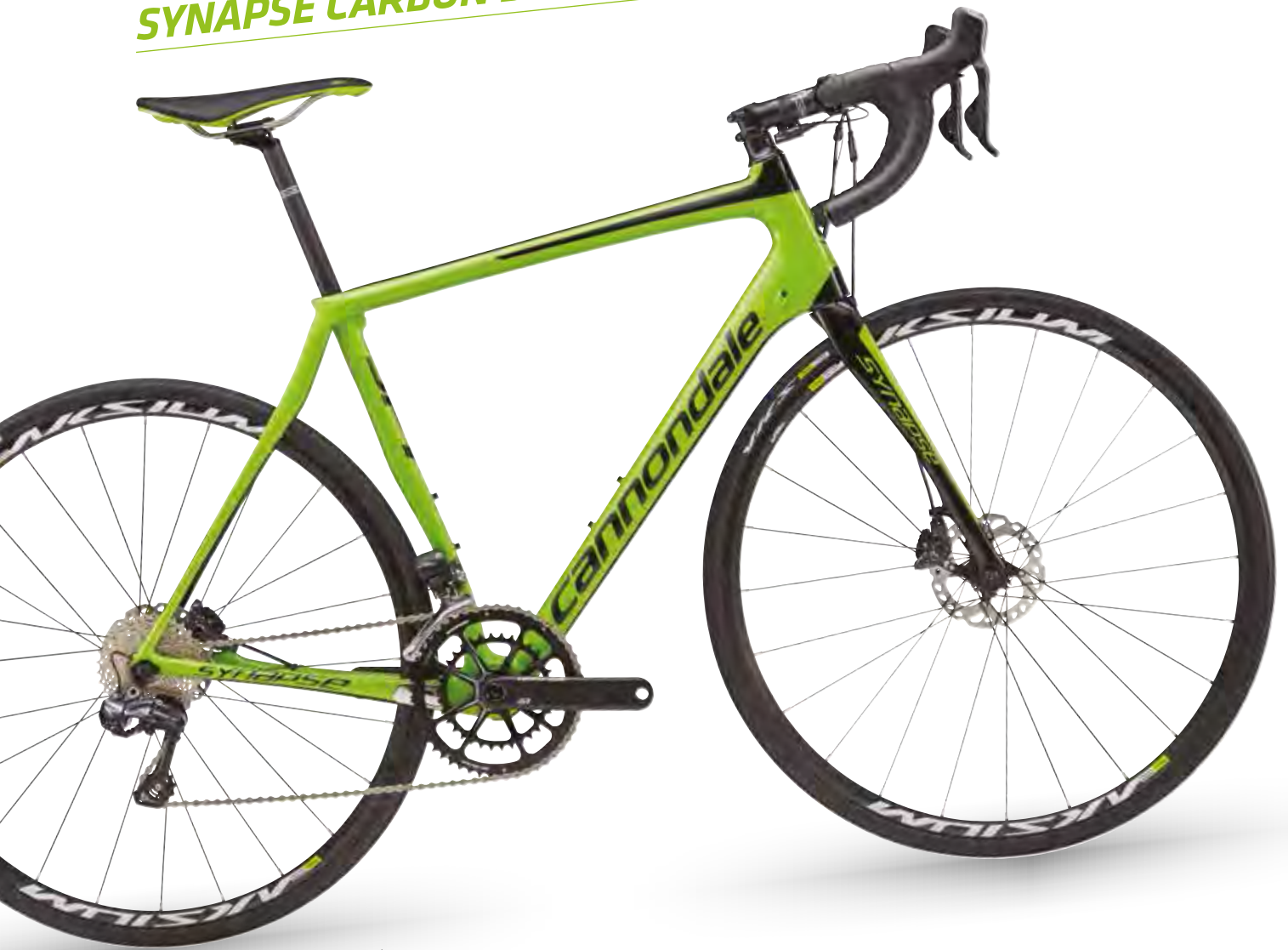
🏆 Berserker Green w/ Jet Black, Gloss - GRN