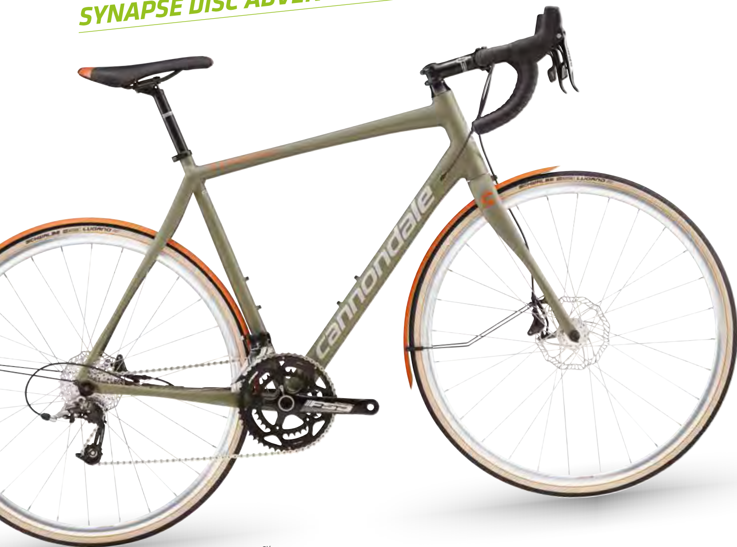
Tree Frog w/ Primer Grey and Burnt Orange, Matte - ADV