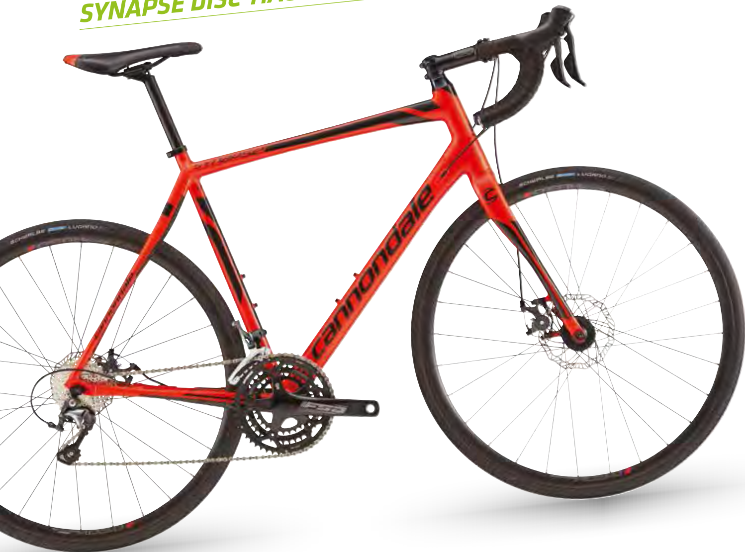
🏆 Acid Red w/ Jet Black, Matte - RED