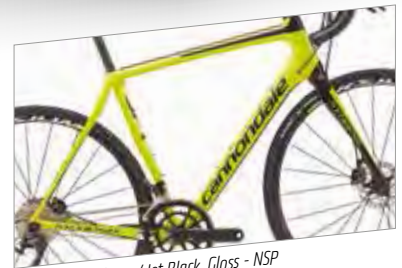
Neon Spring w/ Jet Black, Gloss - NSP