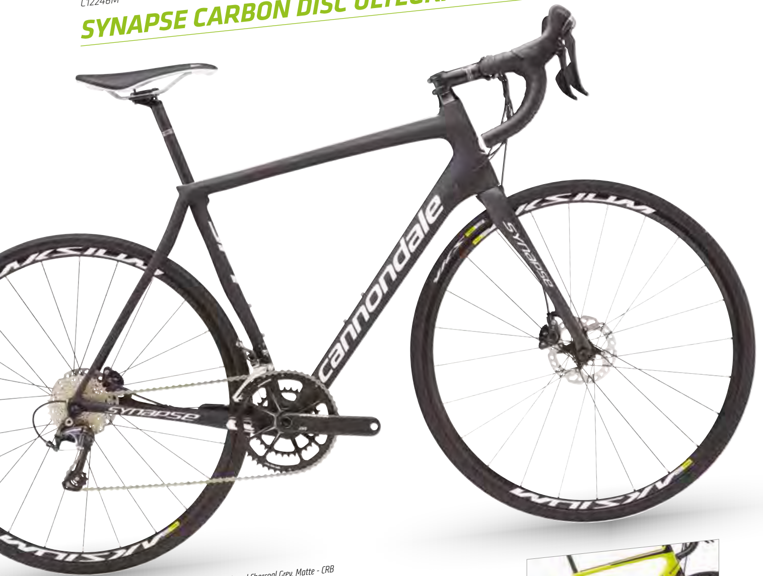
Exposed Unidirectional Carbon w/ Jet Black and Charcoal Grey, Matte - CRB