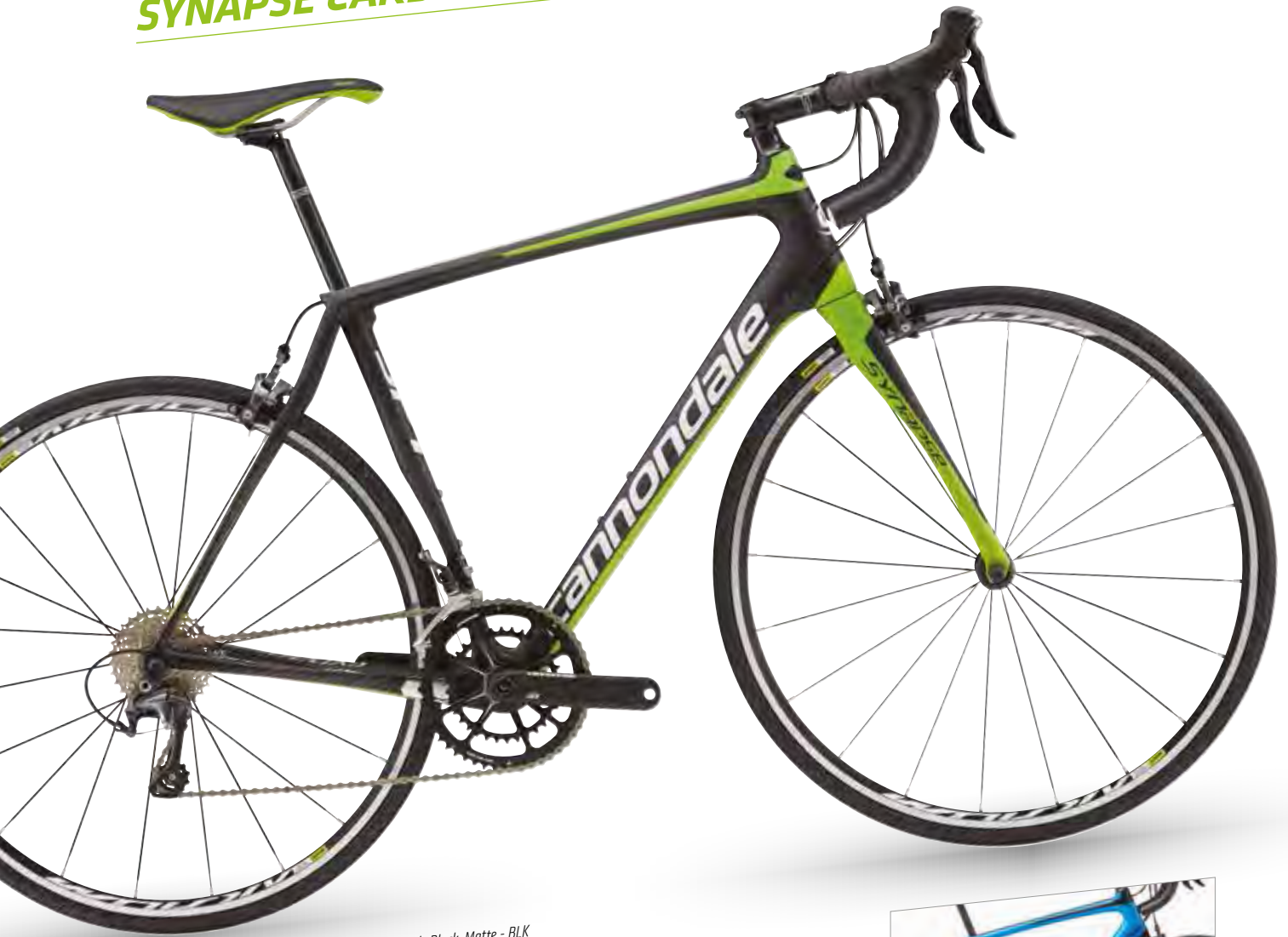
🏆 Berserker Green w/ Magnesium White and Nearly Black, Matte - BLK