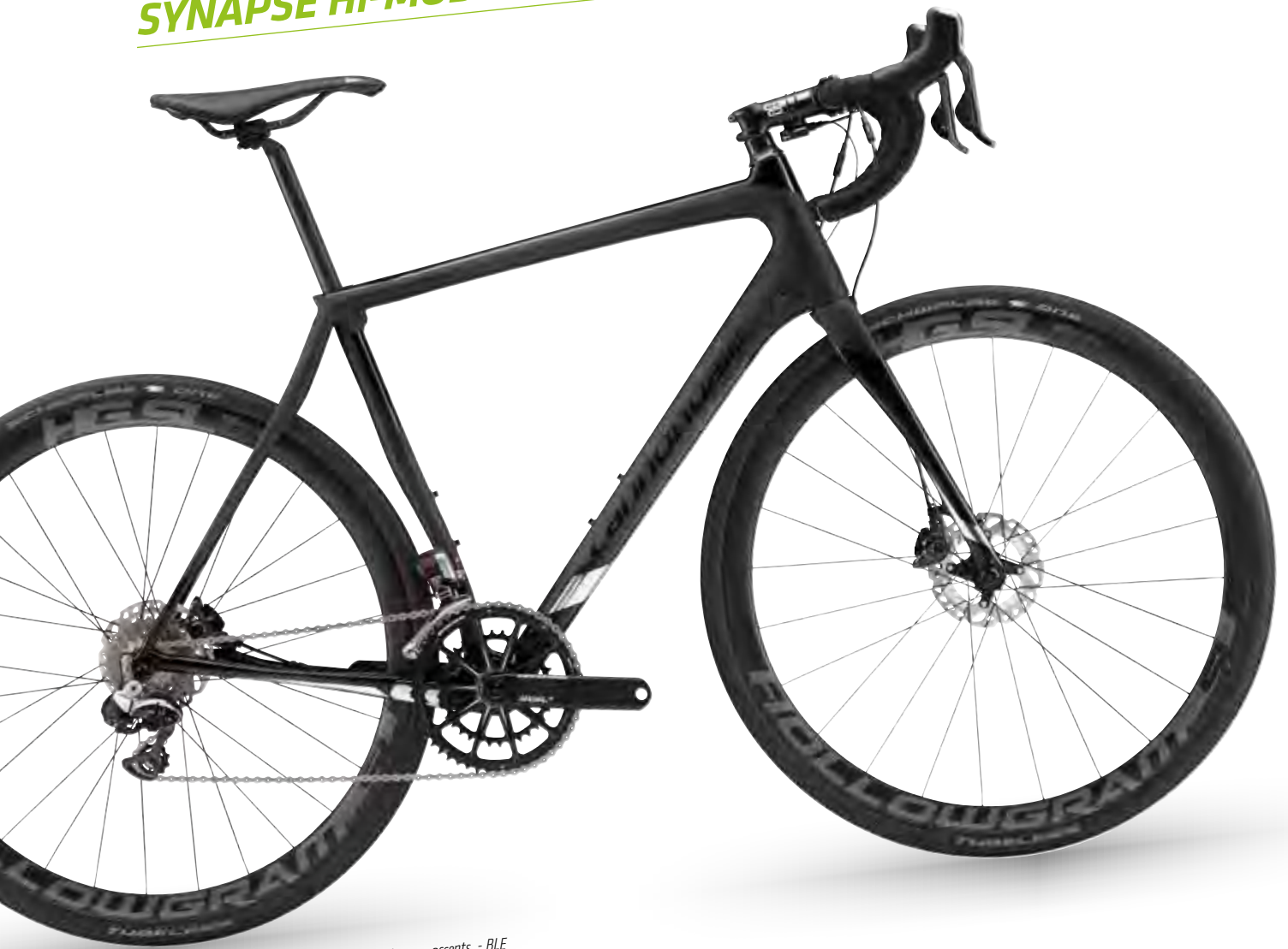
🏆 Satin Black w/ Gloss Black and Polished Chrome accents - BLE