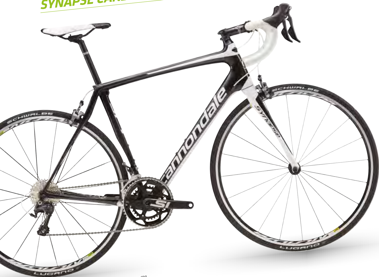
Jet Black w/ Magnesium White and Nearly Black, Matte - CRB