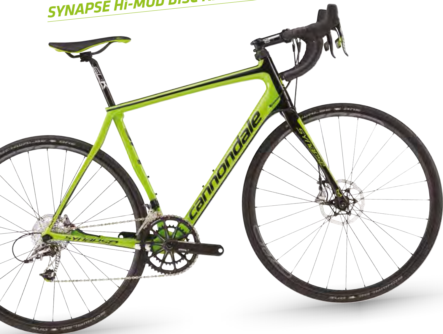
🔑 Berzerker Green w/ Jet Black - GRN