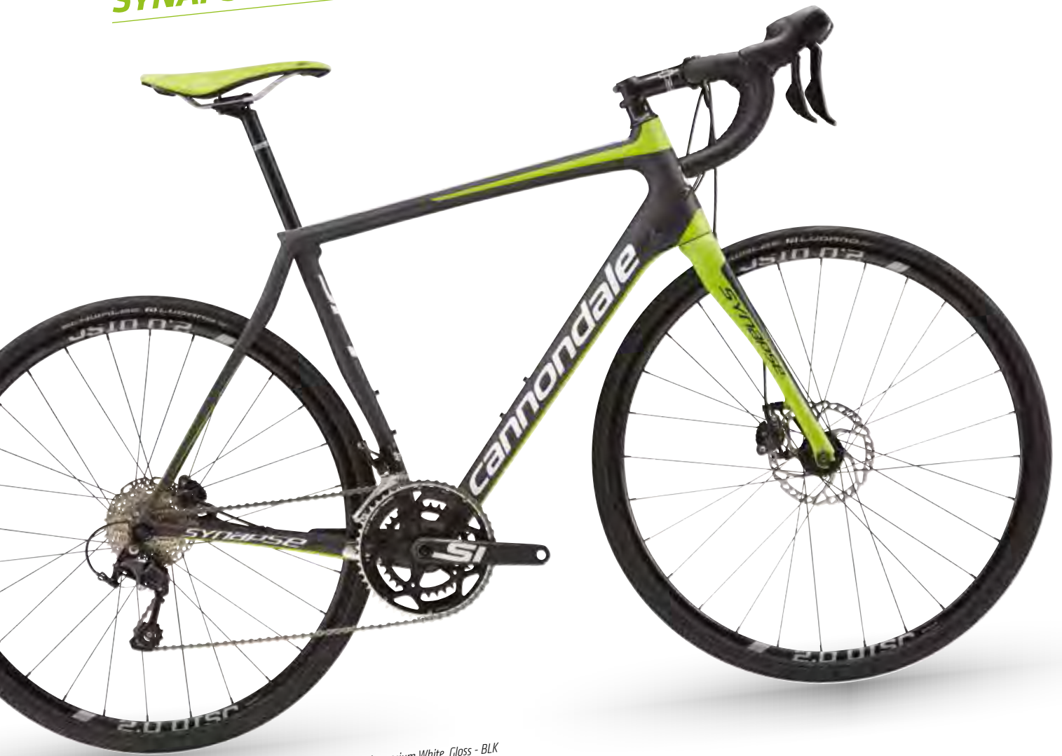
Exposed Unidirectional Carbon w/ Nearly Black and Magnesium White. Gloss - BLK