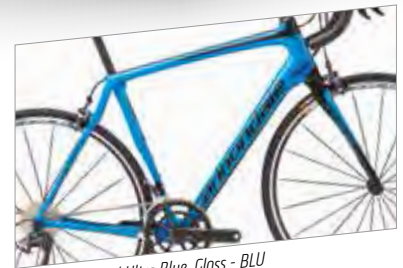
🏆 Jet Black w/ Ultra Blue, Gloss - BLU